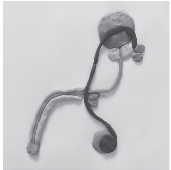
Abb. 2: Geschlechtsorgane von Schüler*innen der 6. Klasse geknetet.